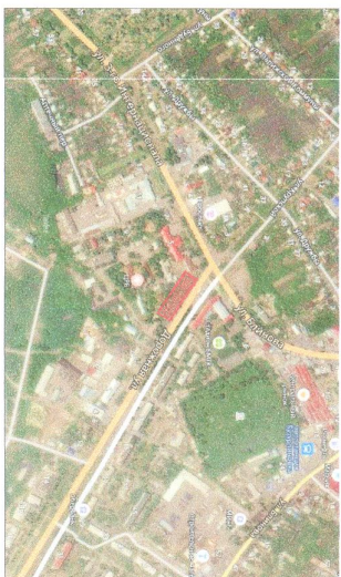
Место расположения земельного участка КН 36:05:0100124.121